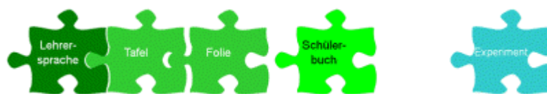
Abb. 1.1: Medien als Puzzle-Teile

Unterrichtsrelevante Medien werden exemplarisch beschrieben mit ihren jeweiligen Leistungen, Problemen, typischen Einsatzzwecken und ihrem Einfluss auf Unterrichtsmethoden.