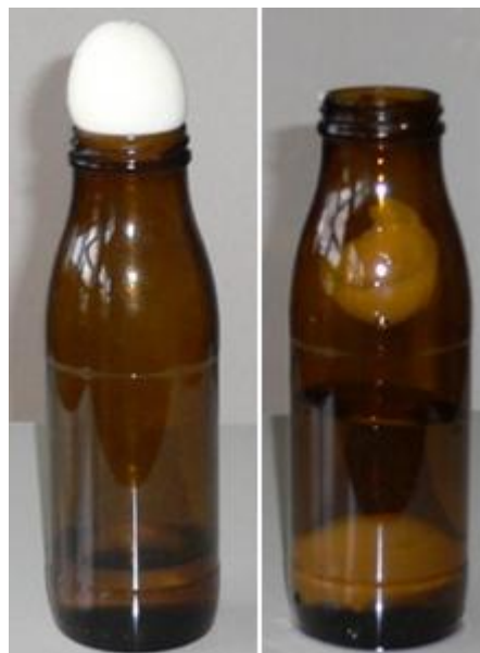
Abb. 1: Ein hart gekochtes und geschältes Ei wird in eine Glasflasche gezogen [7]

Einstieg 1: Im Experiment wird eine Glasflasche zunächst mit heißem Wasser ausgespült. Nun legt man ein hartgekochtes, geschältes Ei auf den Flaschenhals und stellt die Flasche zur Abkühlung in kaltes Wasser. Das Ei wird dabei scheinbar "durch Zauberhand" langsam in die Flasche gezogen. Wie lässt sich dieses Phänomen erklären?